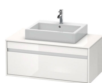
Тумбочка подвесная #KT6695 1000 x 550 мм