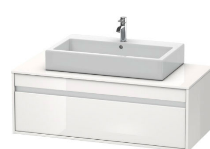
Тумбочка подвесная #KT6696 1200 x 550 мм