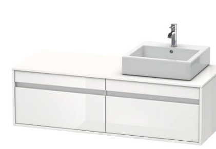
Тумбочка подвесная #KT6697 B/L/R 1400 x 550 мм