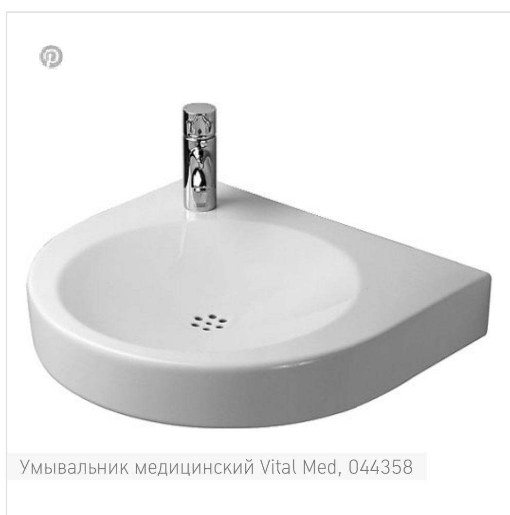
Умывальник медицинский Vital Med, 044358