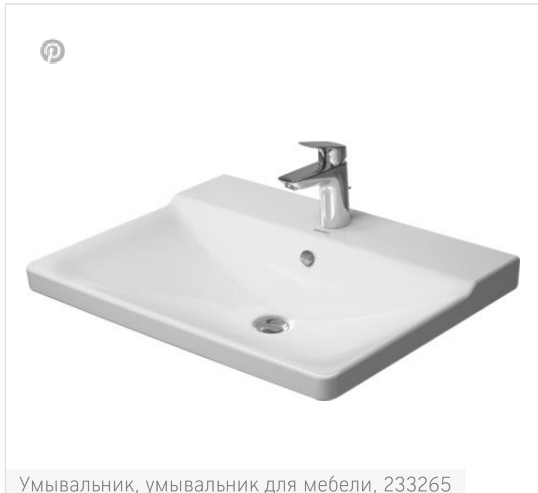
Умывальник, умывальник для мебели, 233265