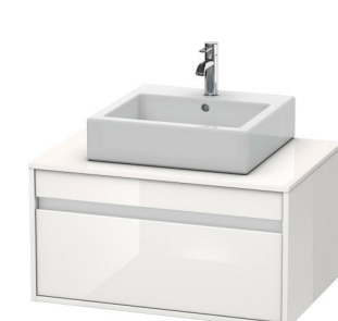
Тумбочка подвесная #КТ6694 800 x 550 мм