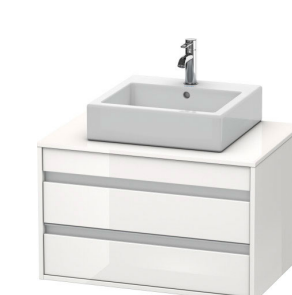
Тумбочка подвесная #КТ6654 800 x 550 мм