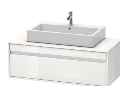
Тумбочка подвесная #КТ6696 1200 x 550 мм