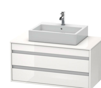
Тумбочка подвесная #КТ6655 1000 x 550 мм