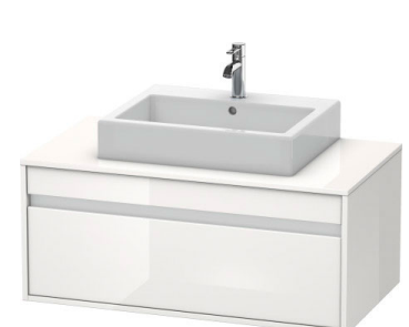
Тумбочка подвесная #КТ6695 1000 x 550 мм